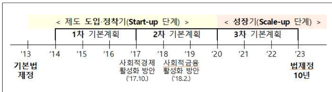
[그림] 협동조합 생애주기와 1~3차 기본계획

자료: 관계부처합동(2020.3.31.) 『제 3차 협동조합 기본계획('20~'22)』